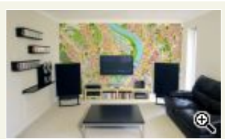
Den ganz persönlichen Stadtplan an der Wand.

Wollten Sie auch schon immer ein ganz persönliches Geschenk machen? Wäre es nicht toll die eigene Wohnung ganz individuell aufzuwerten? Möchten Sie Ihren Lieblingsort immer bei sich tragen? Dann sind hier genau richtig!